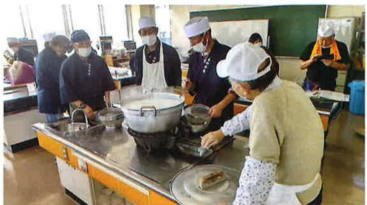
楽しいそば打ち&試食会

煮物が「お袋の味」なら私の蕎麦は「親父の味」。打ち立・茹で立てで食べる蕎麦は家族ご近所からも好評で、将に私の自慢できる唯一の料理となり、また蕎麦は、古来から健康食として愛され、山伏や修験者は山にこもる時そば粉を携帯していたそうです。二中地区公民館に於いて毎月第一日曜に会員