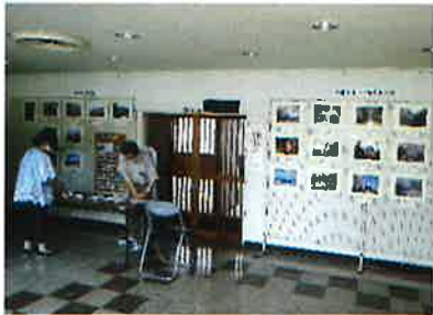
四中地区公民館での展示会

◆写真同好会 二〇二四年八月から会員一一人の様々な写真を選び四中地区公民館に於いて、今年で四回目となる写真展示会を開催しました。 写真の内容も景色、花木、おまつり、イベント、寺社、乗り物など本人の好きな写真を掲示板にセットし公民館に訪れる人達に見てもらいたいとの思いで実施されました。公民館職員の方のお話ですと「来館の皆さんよく見ていますよ」とのことでした。これも、会員の腕が少し上がったためだと思いません。今後の活動については、市民ギャラリーで全会員が展示写真展に参加され、各会員の実績と成ることを目指し、また写真コンテスト等にも参加できれば良いなと思っています。 (東 敬幸)