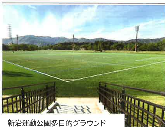
新治運動公園多目的グラウンド

「バックに小町の山々が見えて、広い園内を掃き掃除や見廻りで歩くのがとても楽しいです。土日には子供達が多く、孫を見ている様で癒されます」と目を細めて話してくれました。