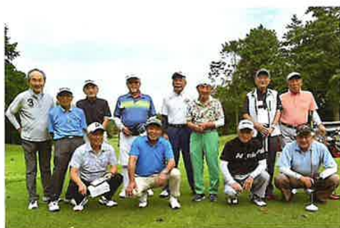
ゴルフ中毒症の皆さんです!

まさかと思うようなパットが入 り思わずガッツポーズとつたが結 果は「ダブルボギー」だったり、渾 身の力で振り切ったボールが有ら ぬ方向へ飛び出し「フアー」の叫 び声が周囲にこだまする、もうや めた!と言いつつ又すぐにやりた くなる、まさにゴルフ中毒症の輩 の集まりです。(高津 利久)