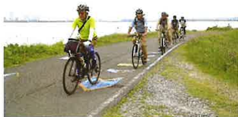
霞ヶ浦湖畔を走行する皆さんです!

例えば一月(神社巡り)・三月(真 鍋の雛祭り)・四月(つくばの桜)・ 五月(下妻のポピー)・九月(雪印 メグミルク及び牛久大仏)・十月 (サイクルーズ船で霞ヶ浦一周)・ 年末(つくし亭の蕎麦等)を楽し んでおります。自転車は、レンタ ル利用(千五百円)ヘルメット付 で安心安全です。是非とも皆様の 参加をお待ちしております。