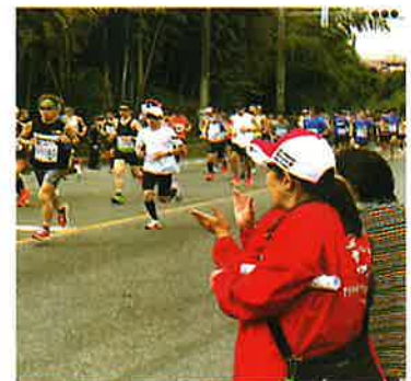
コースキャストボランティア活動