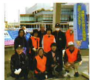
土浦駅周辺の清掃を行う会員の皆さん