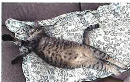
「へそ天のポーズ」 気持ちいいー

名前：鈴愛(スズメ) 性別：女の子 年齢：四才 好物：キャットフード 特技：朝と夕方の薬の気配を察知して逃走すること