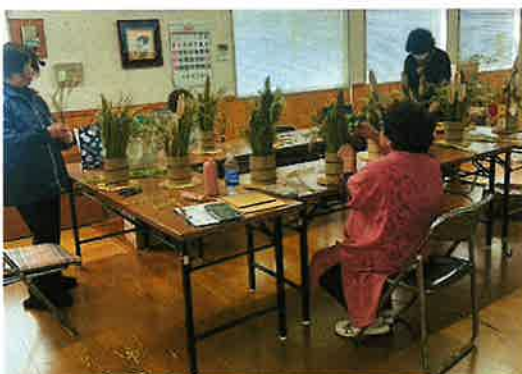
【過去のやまゆり会主催イベント】

募集締め切り : 5月9日(金)まで 受 付 : 029-824-8281(事務局)